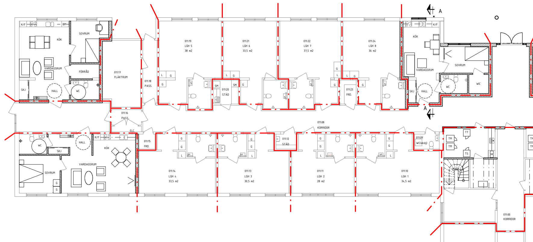
PLAN 1 - DEL 1