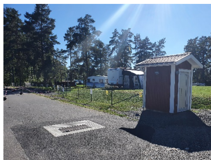
Boxningsklubbens renoverade lokaler samt latrintömning och nytt staket vid Hjortsjöns camping