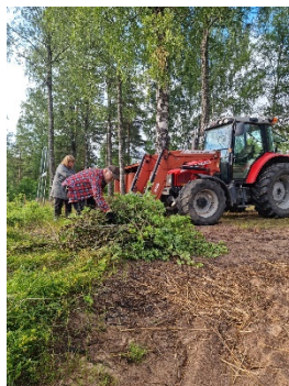
Ideellt arbete vid Linneryds badplats.