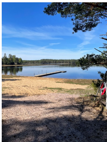
Brygga vid Långasjön i Åker. Resultatet av samarbete mellan Åkers byalag och AME.