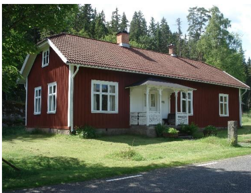
Ålaryds skolmuseum, Åker.

Därutöver finns ett stort antal mindre kända kulturmiljöer som är väl värda att uppmärksamma. Det är angeläget för kommun att stärka och långsiktigt utveckla samverkan med olika aktörer om kulturturism inom kommunen. Det finns även möjligheter att söka regionalt och nationellt stöd och bidrag till sådana projekt i olika format.