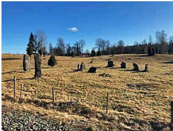
Stenkrets, gravfält, Byarum. Fornlämning.

Kommunen ska verka för att ha aktuella kulturmiljöutredningar och kulturarvsutredningar som belyser hur kulturmiljövärden ska bevaras och utvecklas. Kulturmiljöunderlaget ska beaktas och användas i den ordinarie verksamheten.