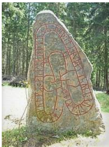
Runsten, Hok. Fornlämning.

Läs mer om fornlämningar och övriga kulturhistoriska lämningar i kommunen på Riksantikvarieämbetets databas fornsök, Fornsök (raa.se) .