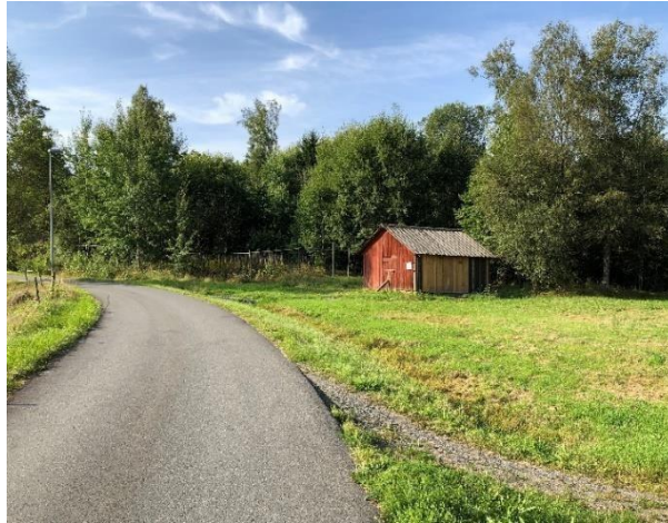
Henningas sommarladugård, Vaggeryd. Byggnad med kulturhistoriska värden.