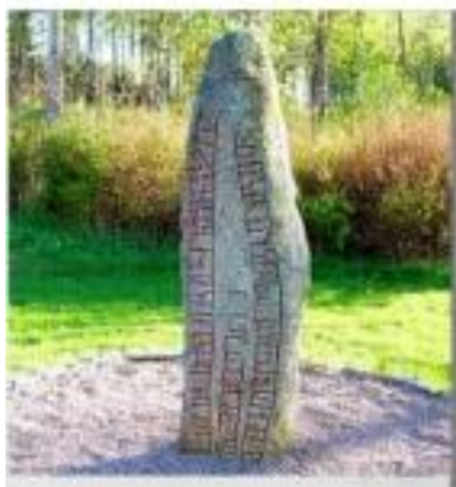
Runsten, Hok. Fornlämning.

Kulturmiljöprogrammet ska vara politiskt antaget och programmet ska uttrycka en politisk vision avseende kulturmiljöarbetet. Underlag och program ska användas, i vilket form de finns är inte det viktiga utan tillämpningen ska stå i fokus. Ansvar: kultur- och fritidsnämnden Finansiering: inom befintlig budget och eget arbete.