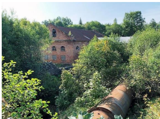
Hoks järnbruk, Hok. Industriellt kulturarv.

Den industriella utvecklingen har på ett avgörande sätt påverkat och utvecklat samhället. Det har förändrat människors arbetsliv, konsumtionsmönster, värderingar och livsformer, liksom för landskap, bebyggelse, teknikutveckling och produktionsutveckling.