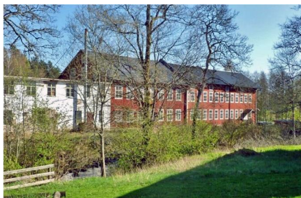
Hagafors Stolsfabrik, Svanerum. Industriellt kulturarv.

I kommunen finns en rik och mångsidig tradition av tillverkning och produktion, både som hantverk och i industrin. Det bestod av att tillverka olika föremål som verktyg, redskap, vagnar och möbler. Verksamheterna ägde rum på skilda platser som i stugor, smedjor och verkstäder eller på skogsmarken. Där skedde produktion av produkter som träkol, tjära, textil och pottaska. Industrialiseringen inbar även tillväxt och utveckling. Entreprenörer bidrog till nya företag och näringar. Exempel är Götafors järnbruk, Hoks järnbruk. Smedjor, kvarnar, sågverk och verkstäder är andra exempel på industriellt kulturarv i kommunen.