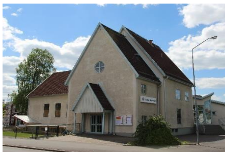
Vaggeryds Missionshus. Byggnad med kulturhistoriska värden.

En utredning av länsstyrelsen i Jönköpings län, 2002. Underlaget inkluderar 55 byggnader i Vaggeryds kommun. Dokumentationen omfattar byggnader mellan 1860–1999. Det består av byggnader och lokaler som har använts eller används av församlingar inom samfund anslutna till svenska frikyrkosamfund.