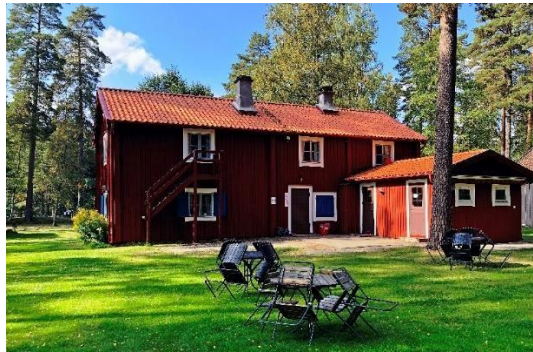
Byarums hembygdspark. Byggnad med kulturhistoriska värden.

Kommunens bibliotek, kulturskola och den öppna ungdomsverksamheten är en del av det nav som bidrar till utvecklandet av den goda kulturkommun vi strävar efter. För att nå ett rikt och varierat kulturutbud bidrar kommunens kulturarbetare, konstnärer, aktiva kulturföreningar, hembygdsföreningar och muséer till den goda och kreativa kvalitén till kommunens invånare. Det är angeläget att aktivt och långsiktigt fortsätta och utveckla samverkan med lokala aktörer som Miliseum, Hembygdsrådet i Vaggeryds kommun och hembygdsföreningar.