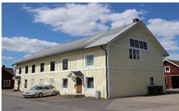
Äldre fabriksbyggnad, f d vagnstillverkning, Vaggeryd. Industriellt kulturarv.