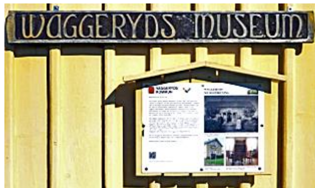
Waggeryds museum, Vaggeryd.

Kommunen upplever att finns ett betydelsefullt och givande samarbete om kulturarv med hembygdsföreningarna och hembygdsrådet. Inom föreningarna finns mycket information och kunskap om lokalhistoria och kulturarv att använda och utveckla inom kommunen.