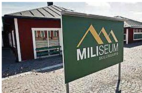
Miliseum, Skillingaryd. Skillingarydslägren, byggnadsminne.

Miliseum är ett militärhistoriskt museum i Skillingaryd som berättar om den indelte soldatens och soldatfamiljens liv samt ingenjörtruppernas verksamhet. Miliseum ligger inom det än idag aktiva militära övningsområdet i Skillingaryd. Miliseum ingår i museinätverket Sveriges Militärhistoriska Arv som består av 27 statliga och statligt stödda museer. Statens försvarshistoriska museer och Statens maritima museer leder och stöder det gemensamma nätverket tillsammans med kommunen.