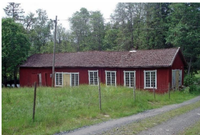
Ljungbergs vagnhjulmakeri i Kvarnaberg, byggnadsminne.