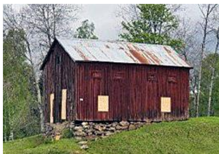
Holma sädesmagasin, Tofteryd. Byggnad med kulturhistoriska värden.

Skillingaryd skjutfält är riksintresse för försvarsmakten. Den militära övningsverksamheten som konstituerar riksintresset innebär även ljudutbredning av skottbullen utanför fältets gränser på motsvarande sätt som trafikbullen från vägar, järnvägar och flygplatser som berör områden utanför trafikanläggningar. Skyddet för riksintresset i detta fall består av att det inte tillkommer störningskänslig bebyggelse inom områden som berörs av centralt beslutade riktvärden för skottbullen, som på sikt innebär risk för begränsningar av verksamheten vid förnyad miljöprovning, s.k. påtaglig skada på riksintresset. Kommunen är skyldig att enligt plan- och bygglagen beakta risken för bullerstörningar vid provning av ansökningar om förhandsbesked och bygglov.