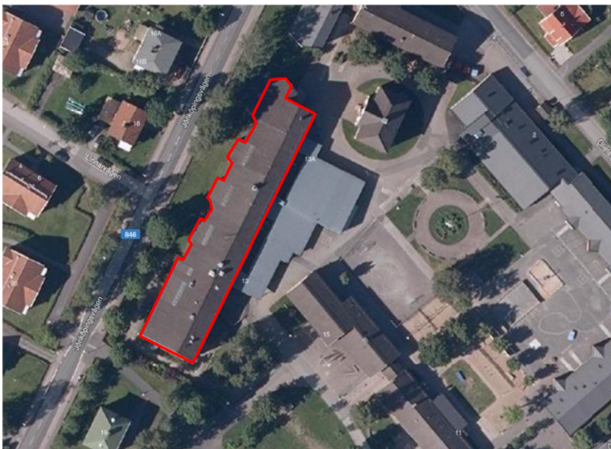
FIGUR 2 BYGGNAD FÖR MILJÖKONTROLL