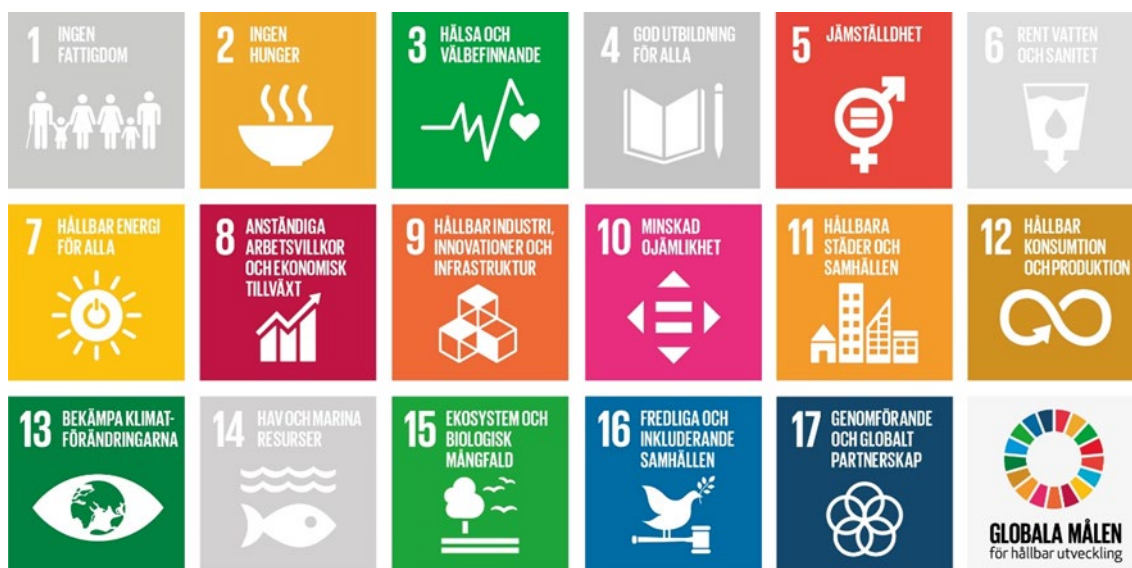
Figur 2 Illustration över de globala målen för hållbar utveckling som främst kopplar till åtgärdsprogrammet.

Tydligast koppling till åtgärdsprogrammet är mål 13 Bekämpa klimatförändringarna. Men fler andra mål kopplar också tydligt till åtgärdsprogrammet. Illustrationen visar på andra mål som kopplar till detta åtgärdsprogram. Under varje åtgärd beskrivs kopplingar till Agenda 2030-målen utöver mål 13 som kopplar till alla åtgärderna i programmet.