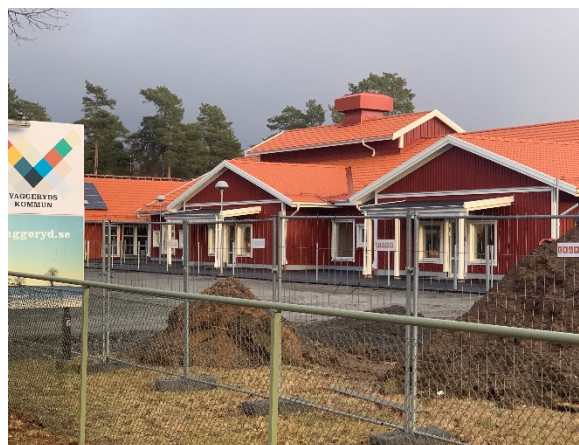
Utbyggnad av Slättnens förskola till 6 avdelningar och tillagningskök.