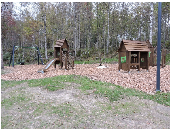
Strömfallet – vattennära mötesplats för lek, träning och avkoppling.