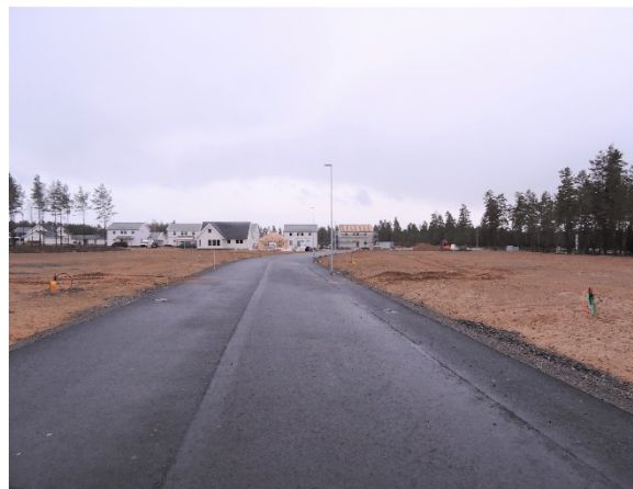
Nya tomter på Västra Strand i Vaggeryd.