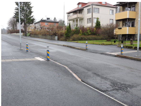
Valdshultsvägen – trafiksäkerhetsåtgärder med säkra passager.