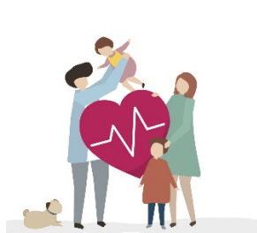
Folkhälsa (Både faktisk och upplevd effekt)

Det ska vara ett brett utbud av kultur och fritidsaktiviteter för de som bor, lever och verkar i Vaggeryds kommun, i alla åldrar, och folkhälsan ska vara god.