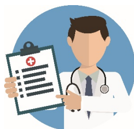
Hälso/ sjukvård och omsorg (Både faktisk och upplevd effekt)