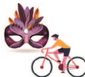
Kultur, fritid och friluftsutbud (Både faktisk och upplevd effekt)