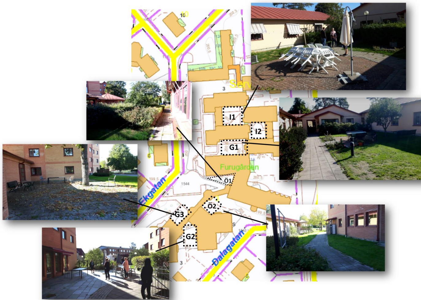
Figur 7: Furugården har fem stycken gemenskapsytor samt några övriga utemiljöer som inte används i verksamheten.

Tillgången till gröna utemiljöer för de boende på Furugården finns i dagsläget i viss utsträckning. Det finns sju utgångar som leder till en gemensamhetsyta utomhus av något slag (det finns även några mindre ytor för demensboendet som inte tas upp här). Fem av dessa gemensamhetsytor har sittplatser med bord och stolar. Ytorna har liknande grundutförande, med låg grönytefaktor, stor andel hårdgjord yta (stenplattor), ett bord och stolar och till viss del även gräsmatta och buskage på vissa ytor. Varje yta beskrivs mer i detalj i bilaga 1- "Furugårdens utomhusmiljöer", men under kommande rubriker beskrivs de gröna utemiljöerna kring boendet i allmänhet.