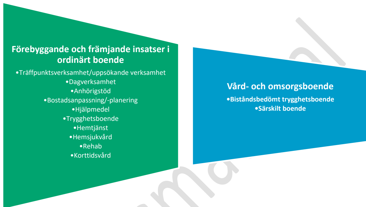
Figur 2. Förebyggande och främjande insatser för boende i ordinärt boende

Kvarboende i ordinärt boende bör eftersträvas så länge det är möjligt fram till den dagen då behovet av vård- och omsorgsboende infinner sig. Figuren nedan beskriver utformning av äldreomsorgen i Vaggeryds kommun och vilka förebyggande och främjande insatser som finns för att möjliggöra kvarboende i ordinärt boende. Ordinärt boende innebär avser i praktiken allt ifrån villa, lägenhet, trygghetsboende eller andra former av boende som man äger eller hyr och som inte är vård- och omsorgsboende.