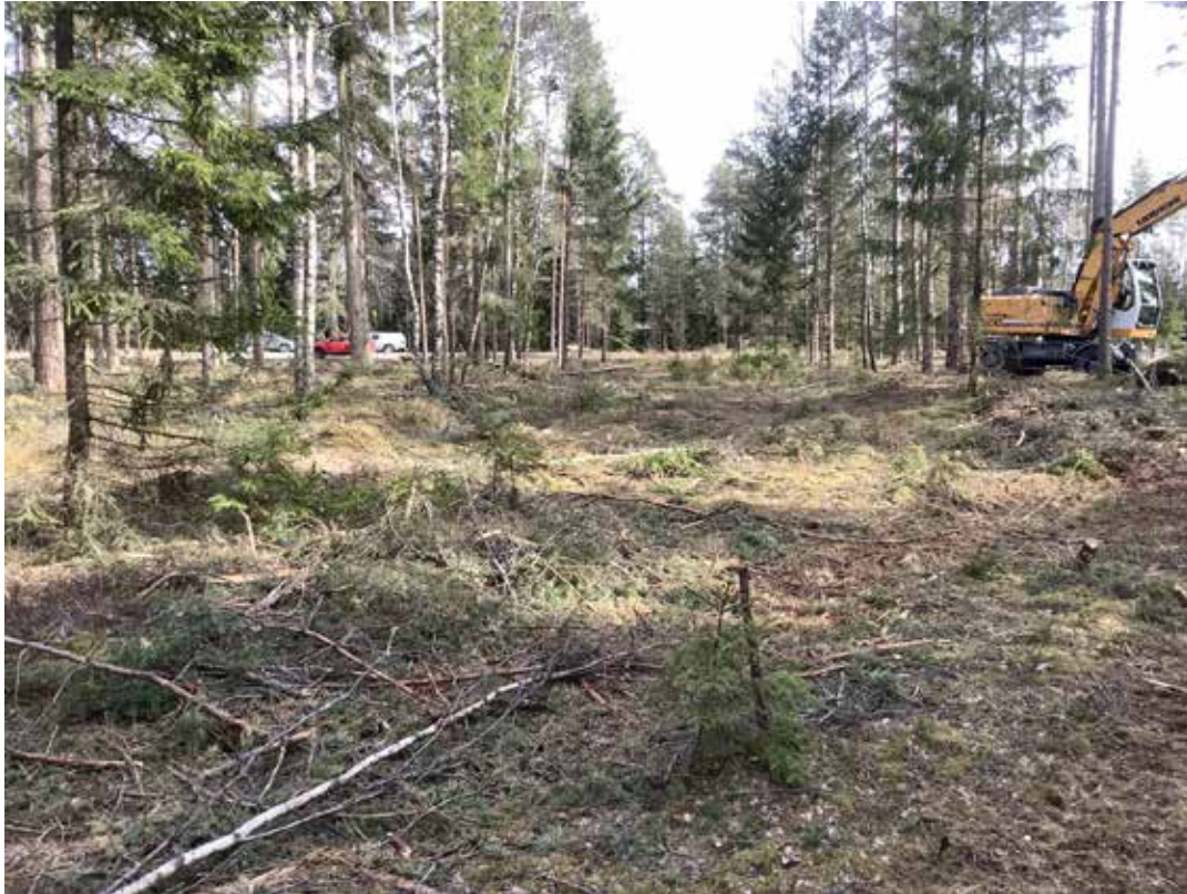
Figur 4. Bredare väg, troligen arbetsväg vid bygge av Europaväg 4.

En tidigare okänd väg 8–9 m bred gick från nordväst till sydöst igenom områdets norra del. Att vägen saknas på historiska kartor samt vägens bredd gör det troligt att vägen är av nyare karaktär. Möjligen en arbetsväg från det att Europaväg 4 byggdes (Figur 4). Strax norr och söder om vägen låg två täkter.