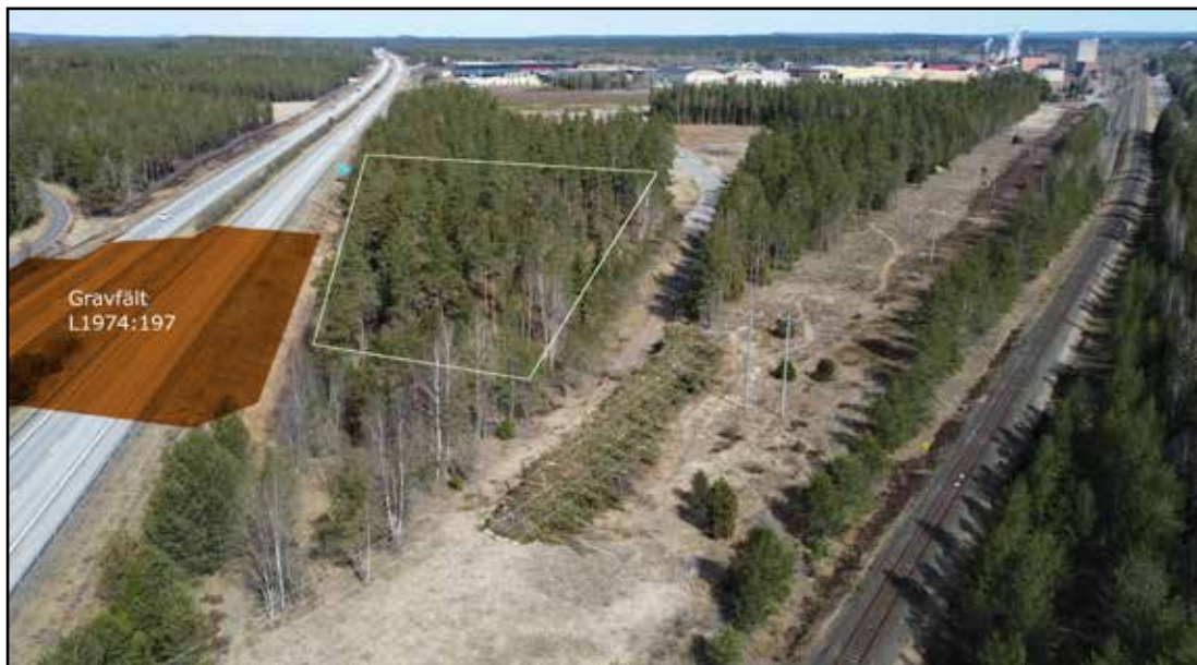
Figur 2. Överblick av det undersökta området i relation till gravfält L1974:197

Vid den tidigare undersökningen av gravfältet påträffades 45 anläggningar uppdelat på 7 domarringar, 16 runda och 13 fyrkantiga stensättningar (ofyllda), 2 fyrkantiga stenkretsar samt 8 resta stenar. Därutöver framkom (minst) 11 omarkerade brandgropar/benlager. Den omfattande användningen av en lättvittrad lokal stensort (Vaggeryds-syenit) i anläggningarna gjorde att resultaten skiljer sig avsevärt från de observationer som gjordes vid en tidigare inventering. I många fall var stenarna helt bortvittrade ovan mark.