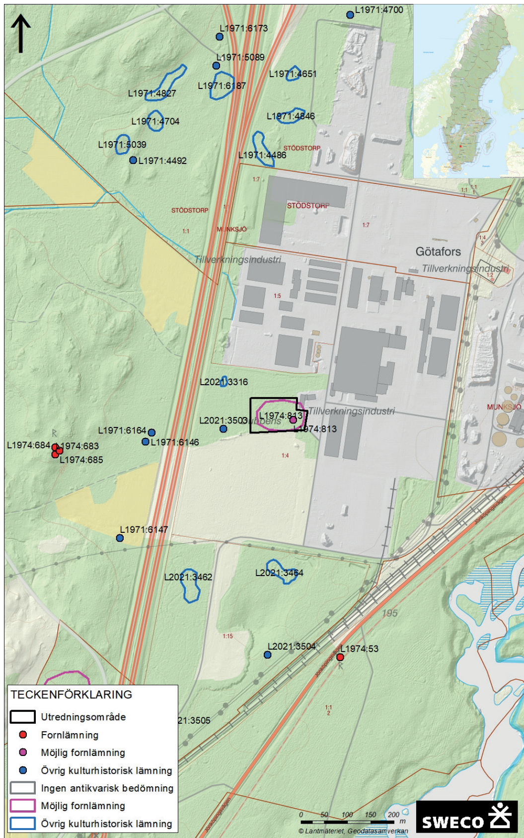
Figur 1. Utdrag ur fastighetskartan med utredningsområdet markerat.