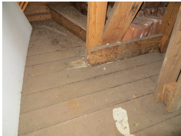
Troligen ursprungligt golv i trapphuset.

Golvet i nästan hela bottenvåningen utgörs av spontade smala brädor utan ytbehandling. I trapphuset finns ett äldre brädgolv bestående av breda brädor utan spont.