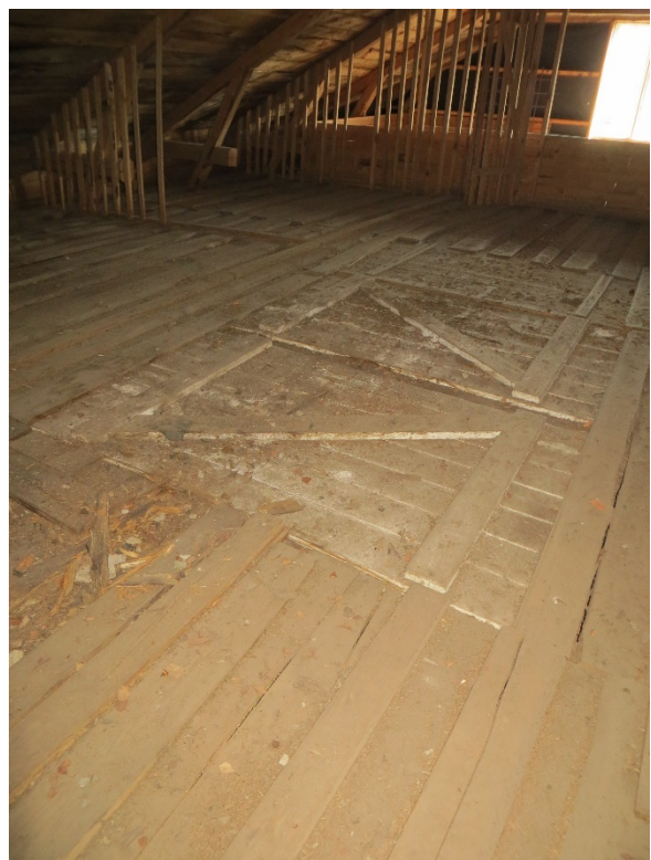
Golvet på vinden har luckor så att man kunde släppa ner foder. Luckorna är i dag blockerade av det senare tillkomna undertaket i stallet.