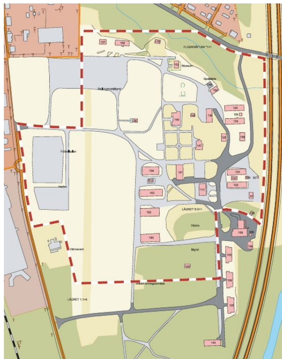
Västra lägrets byggnadsminnesområde.

Åtgärder som strider mot skyddsbestämmelserna kan tillåtas efter tillstånd från Riksantikvarieämbetet.