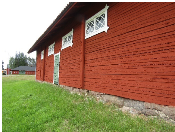
Den östra fasaden med dörr för utgödsling.

stängningsklossar tyder på att alla fönster tidigare haft utvändiga luckor, som varit demonterbara. Den södra gaveln – åtminstone vinden – är försedd med tvåluftsfönster av trä i stående format med spröjsar. Gavelns fönster i bottenvåningen är inte synliga, men kan vara bevarade bakom fönsterluckorna. Samtliga fönster i byggnaden är målade i vit kulör och flertalet omges av släta, korslagda foder som avslutas med figursågerier.