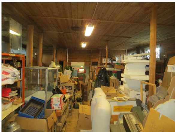
Stallet har stolpar som markerar spiltornas lägen.

Byggnaden har, som nämnts tidigare, en vind. Detta utrymme har ett golv av okantade brädor på lock. För övrigt avgränsas vinden av gavelrösternas fasadpanel och takets undersida. Inga ytor på vinden har någon ytbehandling. Vid några av takstolarnas nedre delar finns stående spjälor av okänd funktion. Vidare finns en låg avgränsning av vinden längst i söder.