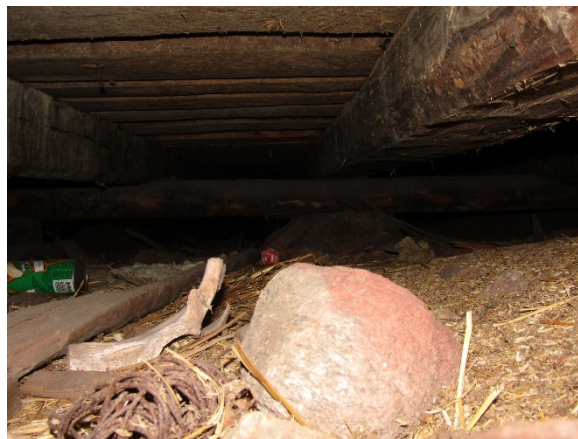
Om man tittar in genom en av sockelns gluggar ser man det som troligen är det ursprungliga golvet:s undersida med okantade brädor.