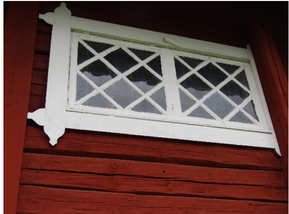
Fönster i stallet där man kan se en vridbar kloss upptill som använts för att reglera luckor. Till höger skymtar en följare och till vänster en täckbräda för en inknutad mellanvägg.

Åren 2000–01 genomfördes en restaurering av byggnaden. Främst gällde det omläggning av yttertaket. Detta bestod delvis av ett sticktak under tegeltaket. Vid arbetena byttes rötskadade delar av takstolarna (taktassarna) och undertaket ut, stickytorna kompletterades med nya stickor, ny oljehärdad masonit med ny läktning lades samt slutligen tillkom nya enkupiga tegelpannor.