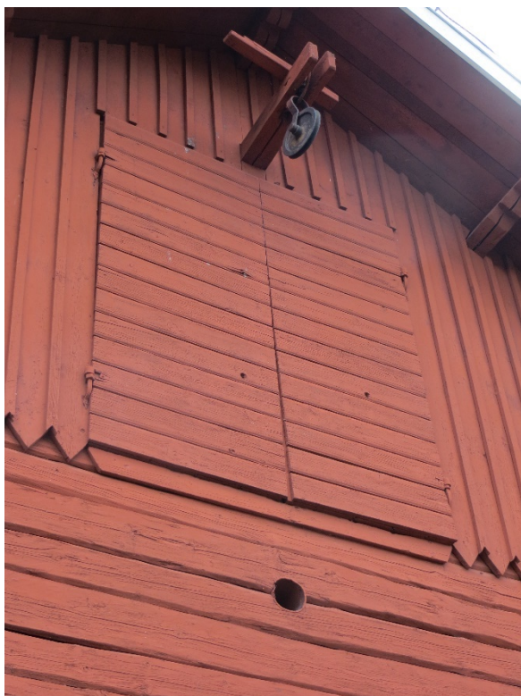
Inlastningen av foder på vinden skedde genom gavelluckor med en vinsch.

Huvudingången har två stora portar utvändigt klädda med fasspontpanel som målats grön. På