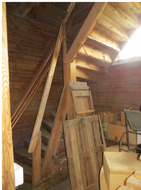
Trapphuset i norr är det mest välbevarade utrymmet i byggnaden.