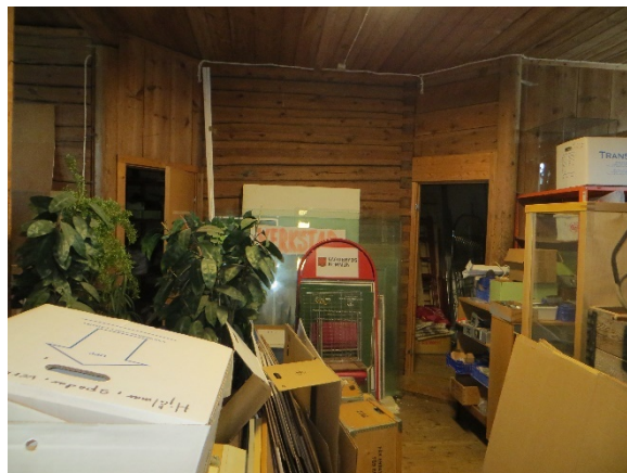
Stallutrymmet avgränsas mot gavelrummen med delvis vinklade väggar av timmer eller stående plank.