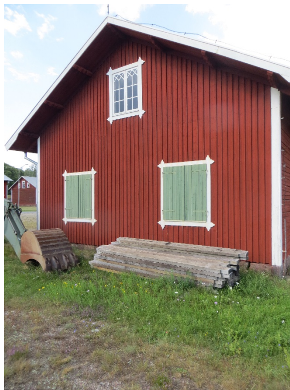
Den södra gaveln med senare tillkommen locklistpanel.

Byggnaden vilar på en sockel av huggen sten. Denna har uttag för ventilation mm.