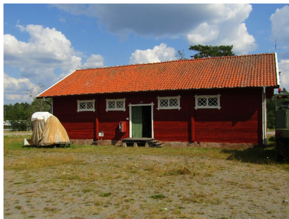
Stallbyggnadens huvudfasad sedd från väster.

Beträffande invändiga åtgärder skall ursprungliga ytskikt bibehållas eller ersättas med likadana.