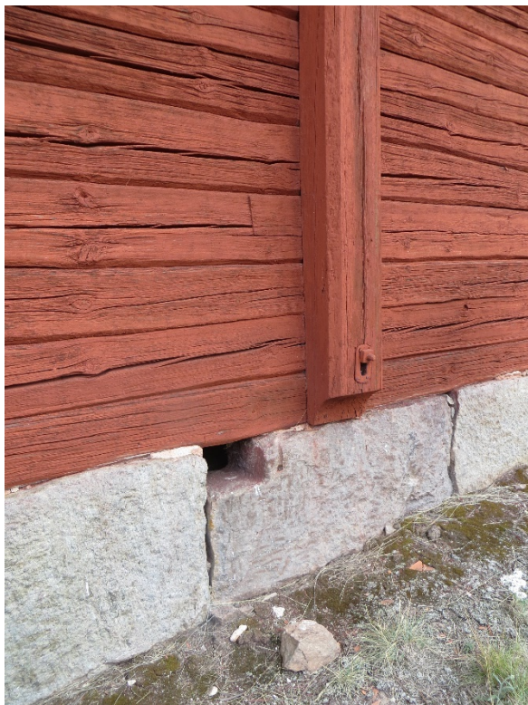
Detalj av sockeln.