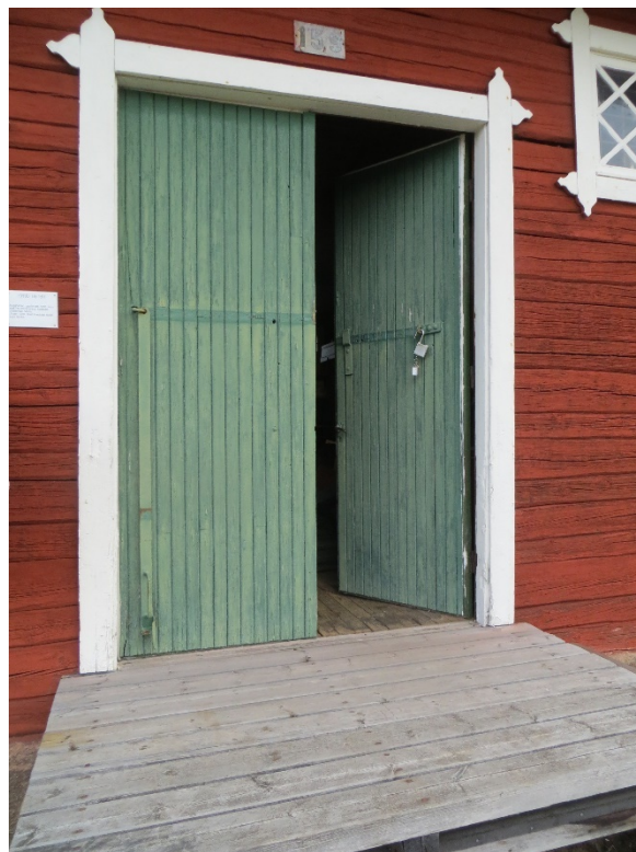
Huvudentrén med ej ursprunglig plattform.