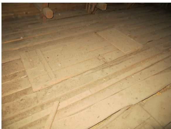
På vinden förvaras en kasserad dörr som möjligen tillhört byggnaden.

Vinden består av ett brädgolv på lock, som beskrivits ovan samt yttertakets undersida.