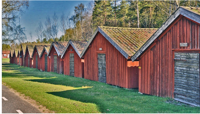
Åkers kyrkstallar, Åker. Byggnader med kulturhistoriska värden.