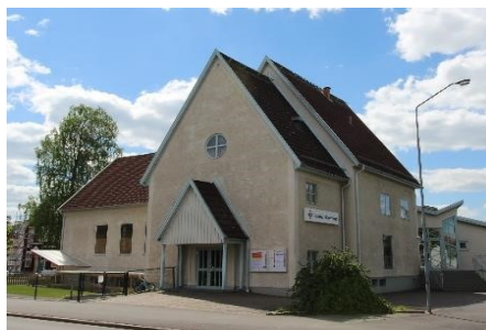
Vaggeryds Missionshus. Byggnad med kulturhistoriska värden.

En utredning av länsstyrelsen i Jönköpings län, 2002. Underlaget inkluderar 55 byggnader i Vaggeryds kommun. Dokumentationen omfattar byggnader mellan 1860–1999. Det består av byggnader och lokaler som har använts eller används av församlingar inom samfund anslutna till svenska frikyrkosamfund.