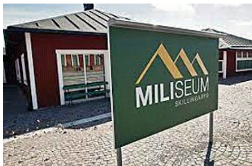
Miliseum, Skillingaryd. Skillingarydslägren, byggnadsminne.

Miliseum är ett militärhistoriskt museum i Skillingaryd som berättar om den indelte soldatens och soldatfamiljens liv samt ingenjörtruppernas verksamhet. Miliseum ligger inom det än idag aktiva militära övningsområdet i Skillingaryd. Miliseum ingår i museinätverket Sveriges Militärhistoriska Arv som består av 27 statliga och statligt stödda museer. Statens försvarshistoriska museer och Statens maritima museer leder och stöder det gemensamma nätverket tillsammans med kommunen.