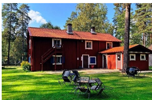
Byarums hembygdspark. Byggnad med kulturhistoriska värden.

Kommunens bibliotek, kulturskola och den öppna ungdomsverksamheten är en del av det som bidrar till utvecklandet av den goda kulturkommun vi strävar efter. För att nå ett rikt och varierat kulturutbud bidrar kommunens kulturarbetare, konstnärer, aktiva kulturföreningar, hembygdsföreningar och museer till den goda och kreativa kvalitén till kommunens invånare. Det är angeläget att aktivt och långsiktigt fortsätta och utveckla samverkan med lokala aktörer som Miliseum, Hembygdsrådet i Vaggeryds kommun och hembygdsföreningar.