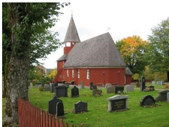
Bondstorps kyrka, kyrkligt kulturminne.

Läs mer om kyrkliga kulturminnen i kommunen på Riksantikvarieämbetets databas bebyggelseregistret, Bebyggelseregistret (BeBR) - Riksantikvarieämbetet (raa.se) .