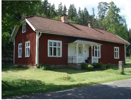
Ålaryds skolmuseum, Åker.