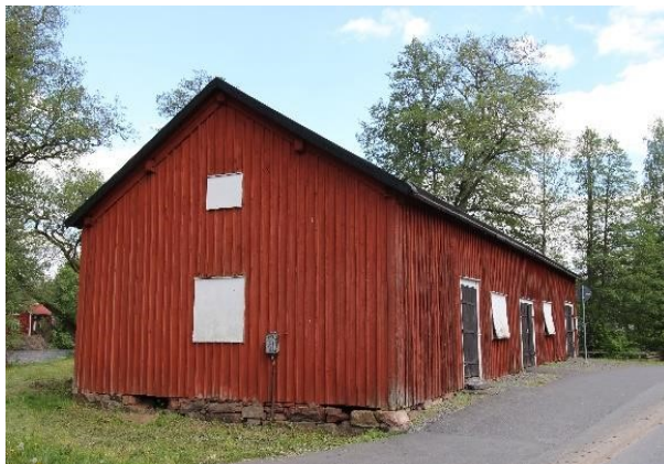
Järnboden i Götafors, Vaggeryd. Byggnad med kulturhistoriska värden.

Kommunen har som målsättning att bevara kulturbyggnader och samtidigt sträva efter att göra dem tillgängliga att besök och upplevelser. Kommunen ska inte upplåta kulturbyggnader för användning eller verksamheter som kan innebära negativ påverkan av kulturvärdena.