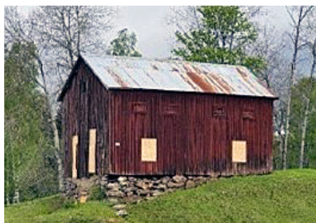
Holma sädesmagasin, Tofteryd. Byggnad med kulturhistoriska värden.

Skillingaryd skjutfält är riksintresse för försvarsmakten. Den militära övningsverksamheten som konstituerar riksintresset innebär även ljudutbredning av skottbullen utanför fältets gränser på motsvarande sätt som trafikbuller från vägar, järnvägar och flygplatser som berör områden utanför trafikanläggningar. Skyddet för riksintresset i detta fall består av att det inte tillkommer störningskänslig bebyggelse inom områden som berörs av centralt beslutade riktvärden för skottbullen, som på sikt innebär risk för begränsningar av verksamheten vid förnyad miljöprovning, s.k. påtaglig skada på riksintresset. Kommunen är skyldig att enligt plan- och bygglagen beakta risken för bullerstörningar vid provning av ansökningar om förhandsbesked och bygglov.