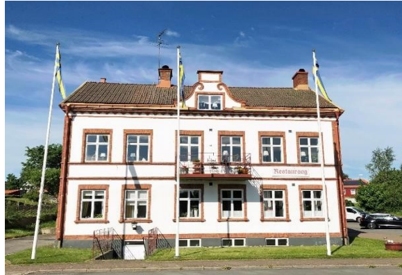
Det före detta Järnvägshotellet, Skillingaryd. Byggnad med kulturhistoriska värden.