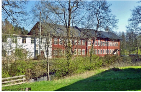
Hagafors Stolsfabrik, Svanerum. Industriellt kulturarv.

Det finns ett material av inventeringar och dokumentationer som Jönköpings läns länsmuseum och hembygdsföreningar har genomfört. Det vore bra att sammanställa det befintliga underlaget och komplettera med en ny utredning som även har en pedagogisk inriktning. Den nya utredningen bör även innehålla en tydlig målsättning hur det industriella kulturarvet och kulturmiljöerna ska bevaras och utvecklas i framtiden. Det är viktigt det industriella kulturarvet blir tillgängligt och kan användas för att intressera och engagera olika målgrupper. Immateriellt kulturarv