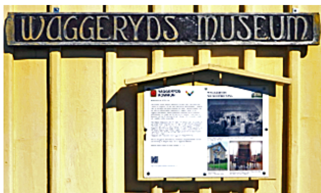
Waggeryds museum, Vaggeryd.