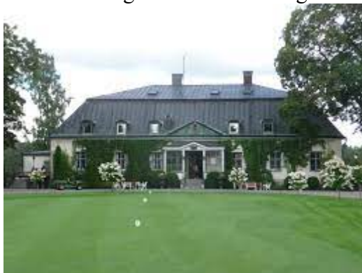
Hooks herrgård, Hok.

I kommunen finns en mångfald av spännande och intressanta kulturmiljöer, kulturhistoriska platser och byggnader. Flera är kända som populära besöksmål, ex. Miliseum, Hoks herrgård, hembygdsgårdar, Ålaryds skolmuseum. Här finns även flera vandringsleder, Munkaleden som ingår i Pilgrimsleder i Småland samt Höglandsleden som ingår i Smålandsleden.