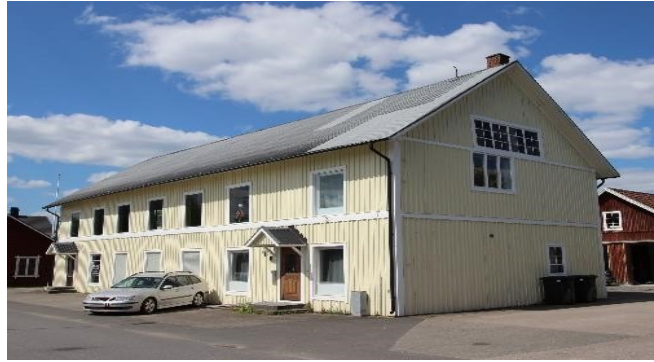
Äldre fabriksbyggnad, före detta Vagnstillverkning. Vaggeryd. Industriellt kulturarv.