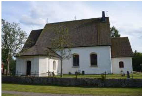
Hagshults kyrka, kyrkligt kulturminne.