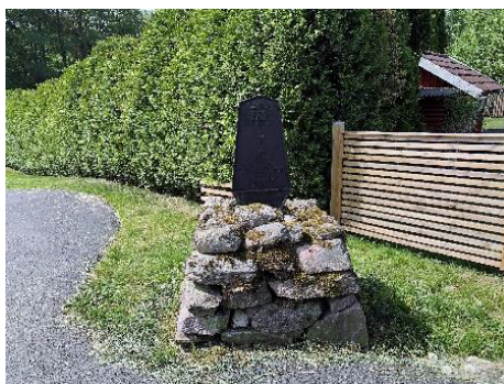
Milsten, Vaggeryd. Fornlämning.