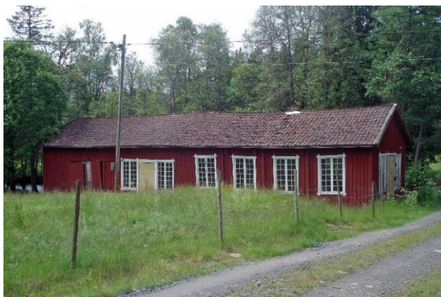
Ljungbergs vagnhjulmakeri i Kvarnaberg, byggnadsminne.