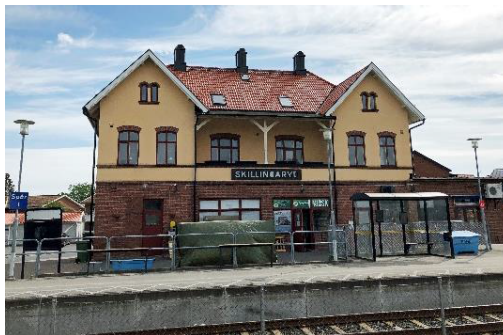
Järnvägsstationen, Skillingaryd, Byggnad med kulturmiljövärden.

Kulturmiljöerna i kommunen har en stor spännvidd. Kommunen är belägen i en gammal kulturbygd som är rik på fornlämningar, värdefulla odlingslandskap och kulturhistoriskt intressanta bebyggelsemiljöer. De äldsta spåren utgörs av boplatser från stenåldern, gravar från bronsåldern och järnåldern. Från yngre järnåldern, från vikingatiden finns flera kända runstenar. På landsbygden finns välbevarade byar med rötter i det äldre agrara kulturlandskapet. Flera större gårdslandskap finns kvar i omlandet kring sjöar och länge nyttjade jordbruksmarker. Kontinuiteten i stadsbilden visas genom bevarade byggnader och bebyggelsemiljöer från 1800-talets handels- och järnvägsorter, tingsplatser och sockencentrum. Det finns även ett rikt och intressant industriellt kulturarv efter olika verksamheter. I tätorterna finns modernistiska byggnader och kvarter av erkänt hög arkitektonisk kvalitet.