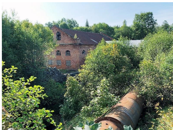
Hoks järnbruk, Hok. Industriellt kulturarv.

Den industriella utvecklingen har på ett avgörande sätt påverkat och utvecklat samhället. Det har förändrat människors arbetsliv, konsumtionsmönster, värderingar och livsformer, liksom för landskap, bebyggelse, teknikutveckling och produktionsutveckling.