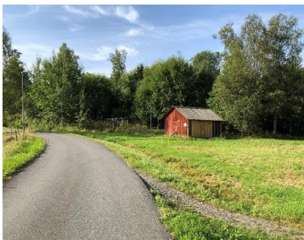
Henningas sommarladugård, Vaggeryd. Byggnad med kulturhistoriska värden.