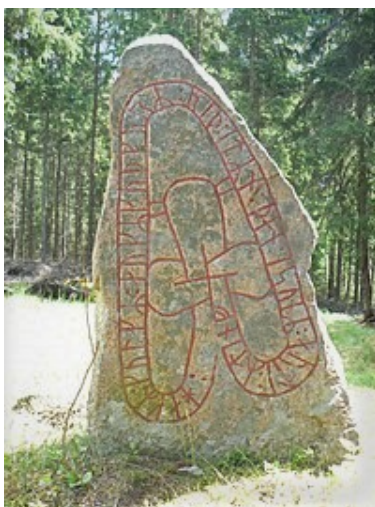
Runsten, Hok. Fornlämning.

Läs mer om fornlämningar och övriga kulturhistoriska lämningar i kommunen på Riksantikvarieämbetets databas fornsök, Fornsök (raa.se) .