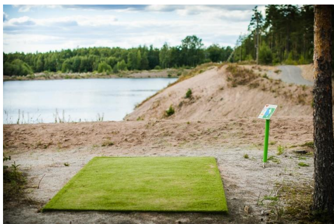
Bilaga 4. TeePad