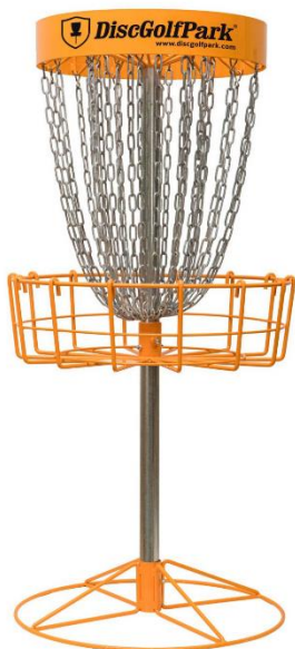
Bilaga 3. Korg