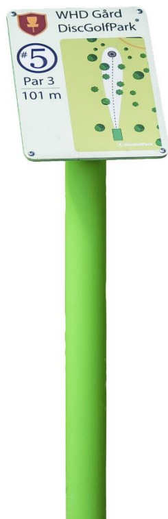
Bilaga 1. TeeSign