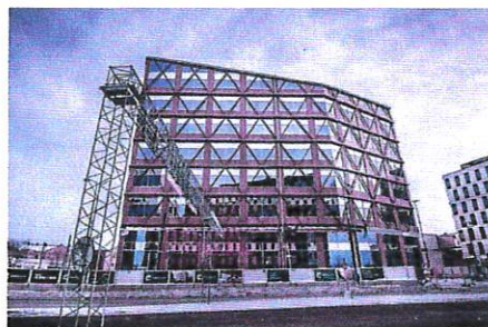
Kvarteret Korsningen i Örebro.