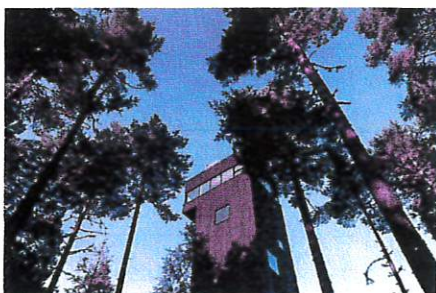
Nya utsiktstornet i naturum Dalarna.