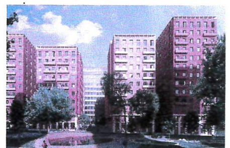
Cederhusen i Hagastaden.