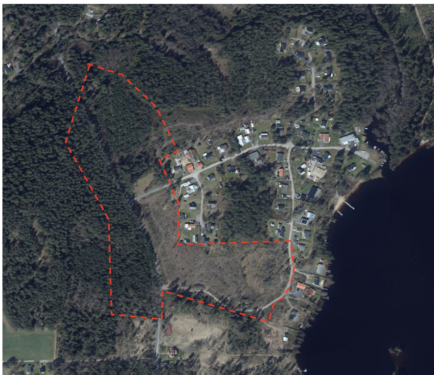
Ortofoto över planområdet med omgivningen

Inom ramen för detaljplanesområdet ska kommunen undersöka om genomförandet av detaljplanen kan antas medföra en betydande miljöpåverkan. Kommunen ska efter genomförd undersökning fatta ett särskilt beslut om genomförandet kan antas medföra betydande miljöpåverkan. Kan betydande miljöpåverkan antas ska en strategisk miljöbedömning göras, Miljöbalken (1988:808) 6 kap 3 §.