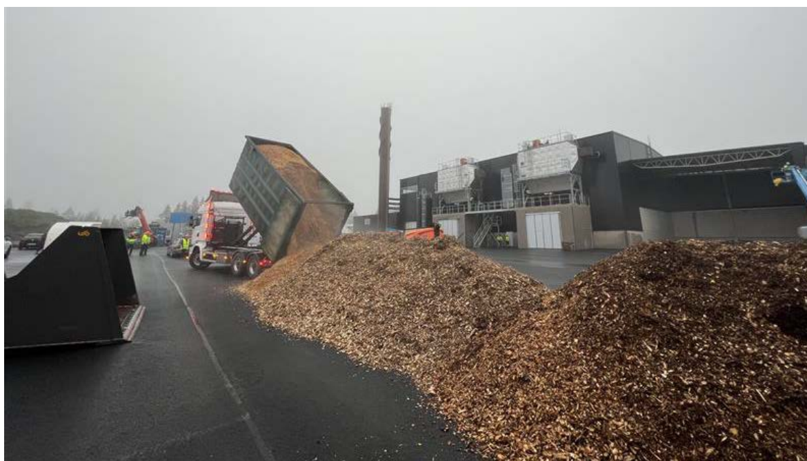
Första lasset med flis till nya värmeverket på Götafors

Bolagets upplåningskostnader har stigit kraftigt under året p.g.a. den ökande räntenivån i samhället samt den nyupplåning som sker för att finansiera de nya anläggningarna som bolaget bygger. Ökande räntekostnader kommer hanteras inom den normala budgetprocessen framåt.