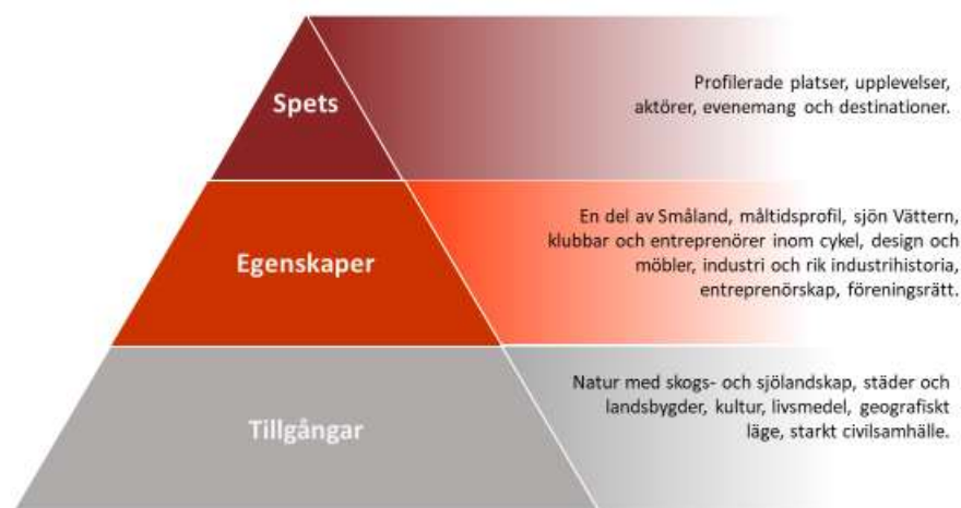
Figur: Förädling av länets utbud till profilerade upplevelser, aktörer, evenemang och destinationer

För att vara ett attraktivt och hållbart län behöver arbetet med att förstärka produktutveckling och innovation växlas upp. Detta görs genom att utgå från de tillgångar som finns i Jönköpings län och ta tillvara de egenskaper som finns för att utveckla länets spets i form av profilerade platser, upplevelser, aktörer, evenemang och destinationer.