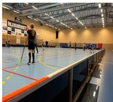
Boxningsklubbens renoverade lokaler samt ny innebandysarg