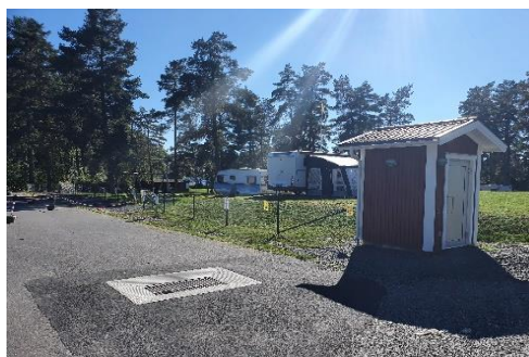
Brygga vid Långasjön i Åker. Resultatet av samarbete mellan Åkers byalag och AME samt latrintömning och nytt staket vid Hjortsjöns camping.