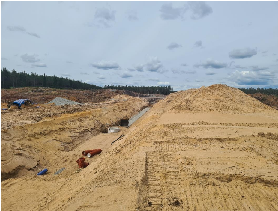
VA-schakt och gatuterrassering på exploateringsområde Stödorp 2:1 norr om travbanan