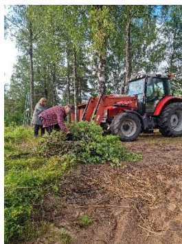
Ideellt arbete vid Linneryds badplats.