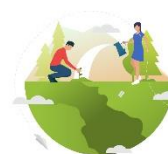
Upplevd effekt hos de som bor, lever och verkar i Vaggeryds kommun

Exempel på hur effekterna syns i våra verksamheter: