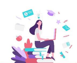
Lärande och utbildning