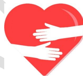
Upplevd effekt hos de som bor, lever och verkar i Vaggeryds kommun

Exempel på hur effekterna syns i våra verksamheter: