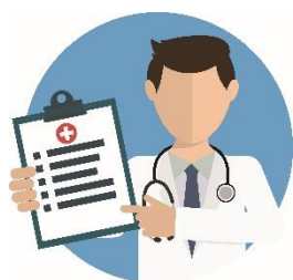
Hälso/ sjukvård/ omsorg