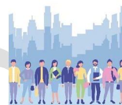
Upplev effekt hos de som bor, lever och verkar i Vaggeryds kommun

Exempel på hur effekterna syns i våra verksamheter: