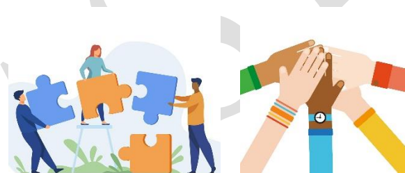
Alla invånare en resurs – (ingår i demokrati) Tillgänglighet