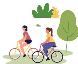
Kultur, fritid och friluftsutbud