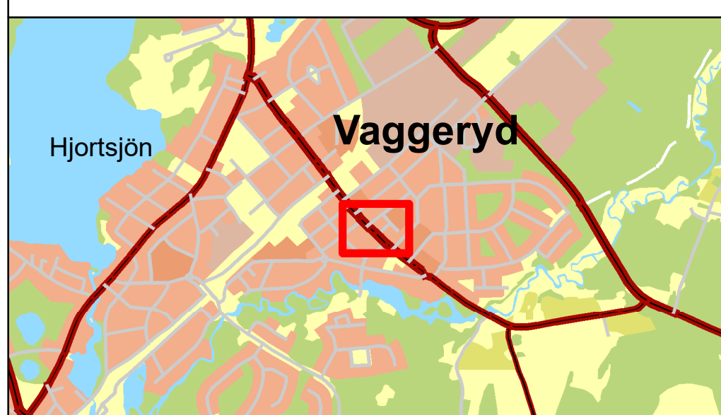
Översiktskarta, skala 1:20 000