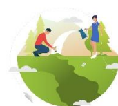
Upplevd effekt hos de som bor, lever och verkar i Vaggeryds kommun

Exempel på hur effekterna syns i våra verksamheter: