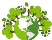
Miljö och naturresurser