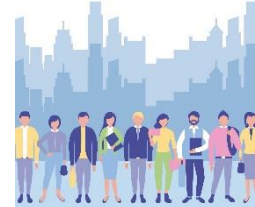
Upplev effekt hos de som bor, lever och verkar i Vaggeryds kommun

Exempel på hur effekterna syns i våra verksamheter: