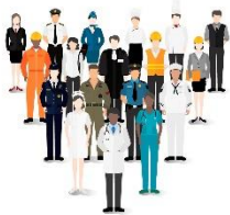
Näringsliv och arbetsmarknad