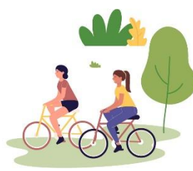
Kultur, fritid och friluftsutbud