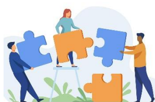
Alla invånare en resurs