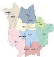
Hållbar tillväxt i hela kommunen