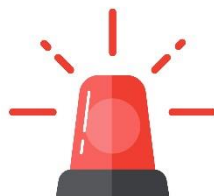
Beredskap mot oönskade händelser