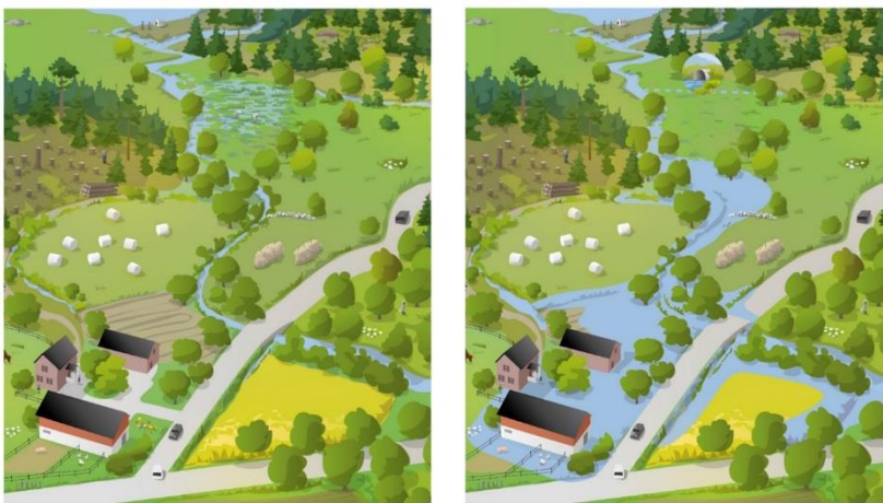
VÅTMARKER HÅLLER KVAR VATTEN I LANDSKAPET - ÖVERSVÄMNINGAR UNDVIKS

Ekosystemtjänster är de gratistjänster som naturen ger oss människor. Det kan till exempel vara material i form av skogsråvara, mat genom livsmedelsproduktionen, vatten- och luftrening eller möjlighet att utöva friluftslivsaktiviteter i gröna områden. En ekosystemtjänst som knyter an till dagvattenstrategin är klimatanpassning i form av att våtmarker fungerar som vattenreglerande magasin vid översvämningar. Befintliga eller nyskapade våtmarker kan användas som en dagvattenlösning.