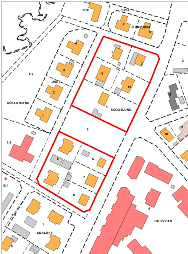
Figur 3: Upphävande av tomtindelningar gäller de fastigheter som är inom rödmarkerat område i bilden ovan.

De fastigheter som berörs av upphävandet av tomtindelningar är Skogslund 1, 2, 4, 6, 7, 8, 9, 10 och 11. Tomtindelning för fastigheten Skogslund 5 har tidigare upphävts.