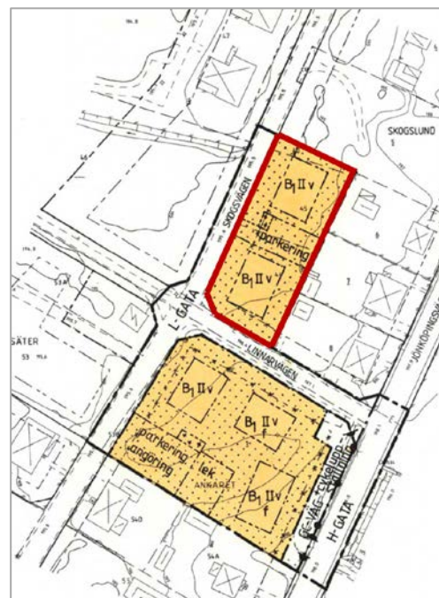
Figur 2: utdrag ur detaljplan, laga kraft 1990-11-19