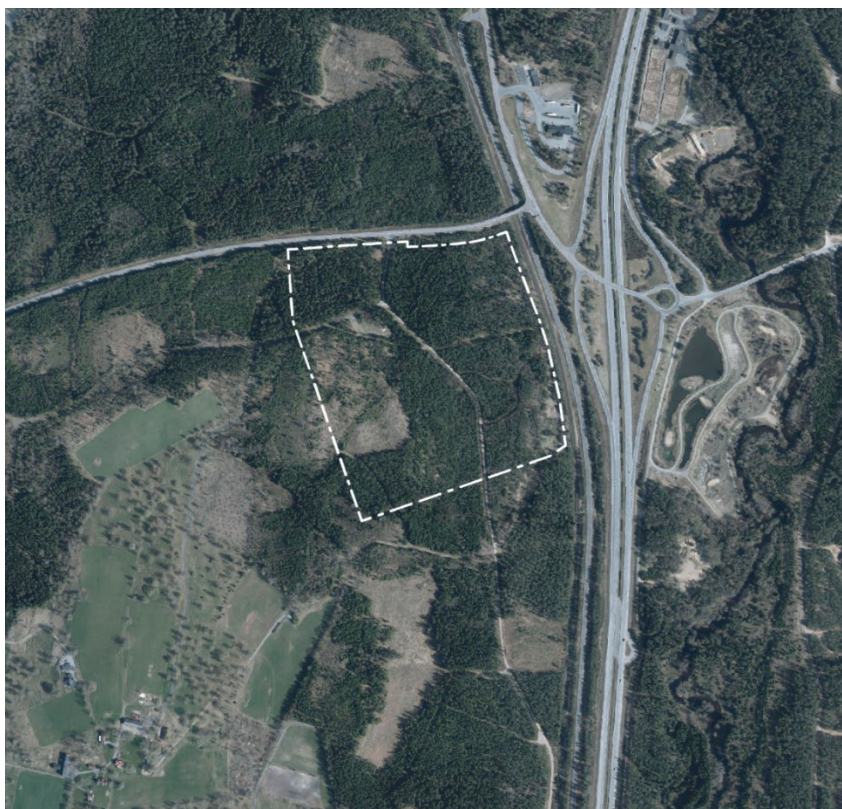
Ortofoto över planområdet med omgivningen

Ansvarig förvaltning: Kommunledningskontoret Samrådshandling Upprättad juli 2024 Utökat förfarande Dnr. KS 2023/111