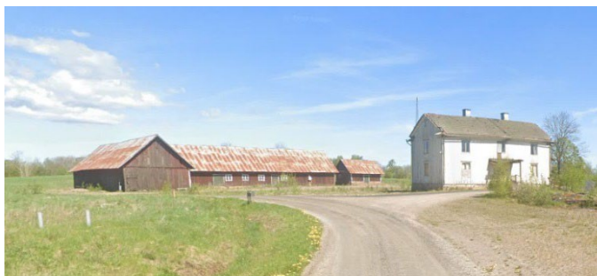
Bilder från google maps från området