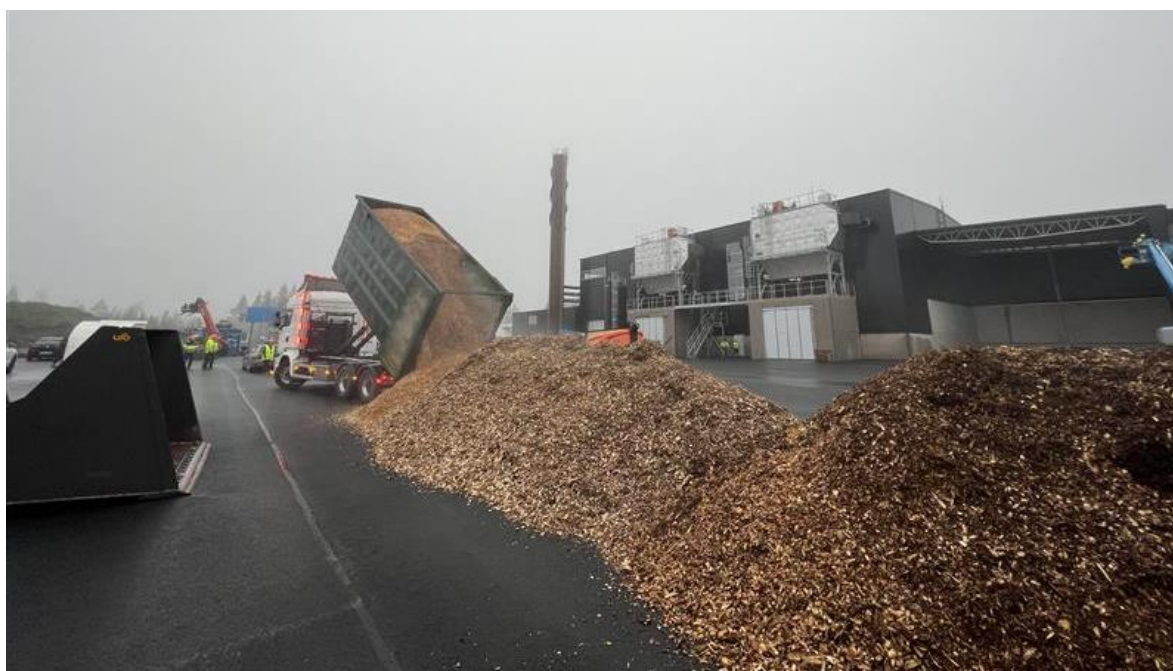
Första lasset med flis till nya värmeverket på Götafors

Bolagets upplåningskostnader har stigit kraftigt under året p.g.a. den ökande räntenivån i samhället samt den nyupplåning som sker för att finansiera de nya anläggningarna som bolaget bygger. Ökande räntekostnader kommer hanteras inom den normala budgetprocessen framåt.