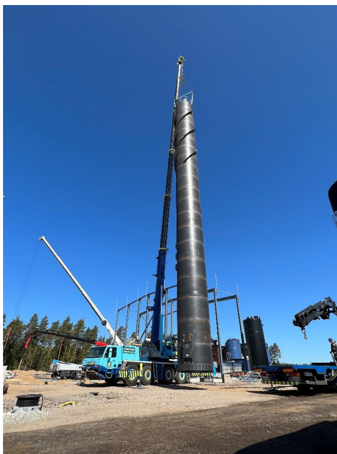
Uppförande av skorsten vid byggnation av nytt fjärrvärmeverk.