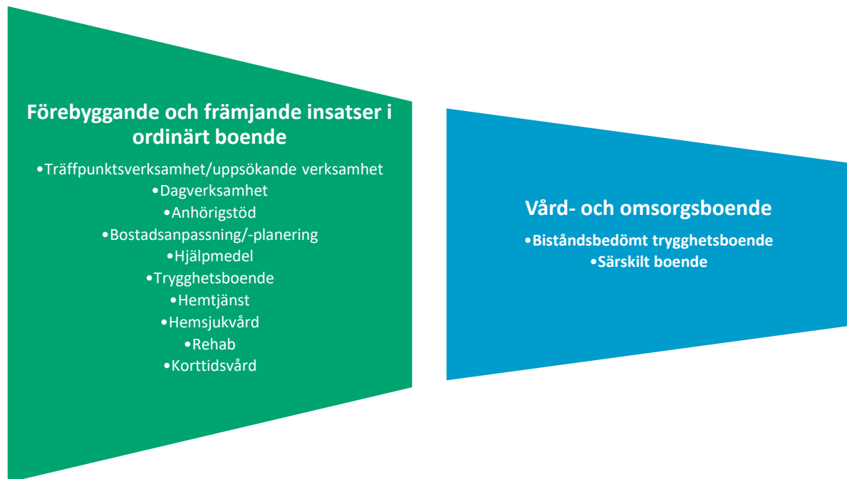
Figur 2. Förebyggande och främjande insatser för boende i ordinärt boende

Kvarboende i ordinärt boende bör eftersträvas så länge det är möjligt fram till den dagen då behovet av vård- och omsorgsboende infinner sig. Figuren nedan beskriver utformning av äldreomsorgen i Vaggeryds kommun och vilka förebyggande och främjande insatser som finns för att möjliggöra kvarboende i ordinärt boende. Ordinärt boende innebär i praktiken allt ifrån villa, lägenhet, trygghetsboende eller andra former av boende som man äger eller hyr och som inte är vård- och omsorgsboende.