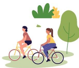
Kultur, fritid och friluftsutbud