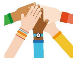
Upplagd effekt hos de som bor, lever och verkar i Vaggeryds kommun

Exempel på hur effekterna syns i våra verksamheter: