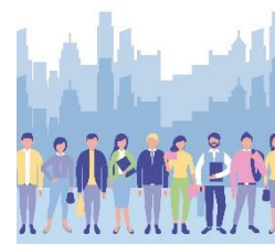
Upplev effekt hos de som bor, lever och verkar i Vaggeryds kommun

Exempel på hur effekterna syns i våra verksamheter: