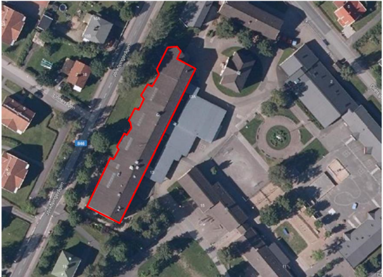
FIGUR 2 BYGGNAD FÖR MILJÖKONTROLL