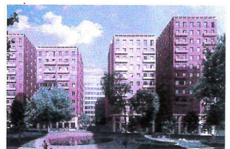
Cederhusen i Hagastaden.