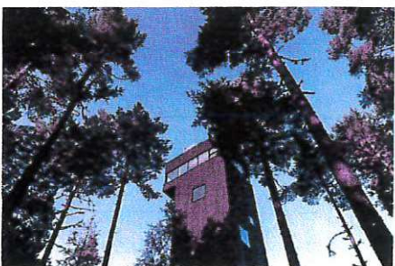
Nya utsiktstornet i naturum Dalarna.