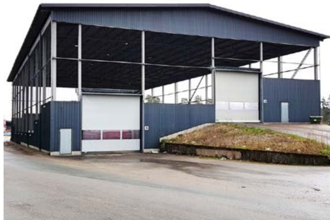
Bild till vänster: Omlastningsstation Stomsjö avfallsanläggning, Värnamo kommun. Bild ovan: Omlastningsstation Mossarp, Gislaved kommun.