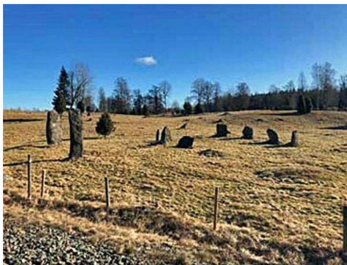
Stenkrets, gravfält, Byarum. Fornlämning.

Kommunen ska verka för att ha aktuella kulturmiljöutredningar och kulturarvsutredningar som belyser hur kulturmiljövården ska bevaras och utvecklas. Kulturmiljöunderlaget ska beaktas och användas i den ordinarie verksamheten.