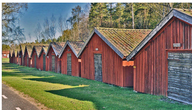
Åkers kyrkstallar, Åker. Byggnader med kulturhistoriska värden.