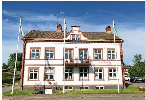
Det före detta Järnvägshotellet, Skillingaryd. Byggnad med kulturhistoriska värden.