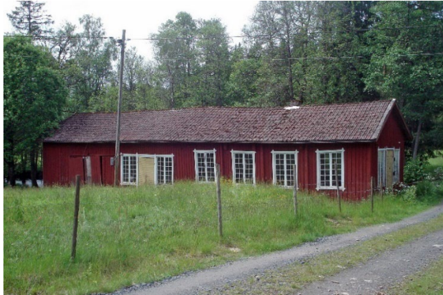
Hjulverkstaden i Kvarnaberg, byggnadsminne.