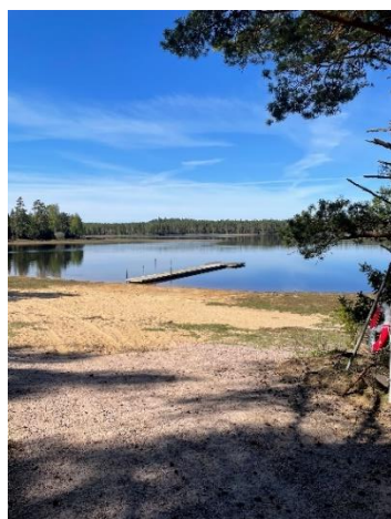
Brygga vid Långasjön i Åker. Resultatet av samarbete mellan Åkers byalag och AME.