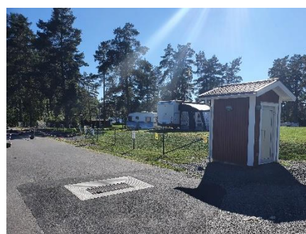
Boxningsklubbens renoverade lokaler samt latrintömning och nytt staket vid Hjortsjöns camping