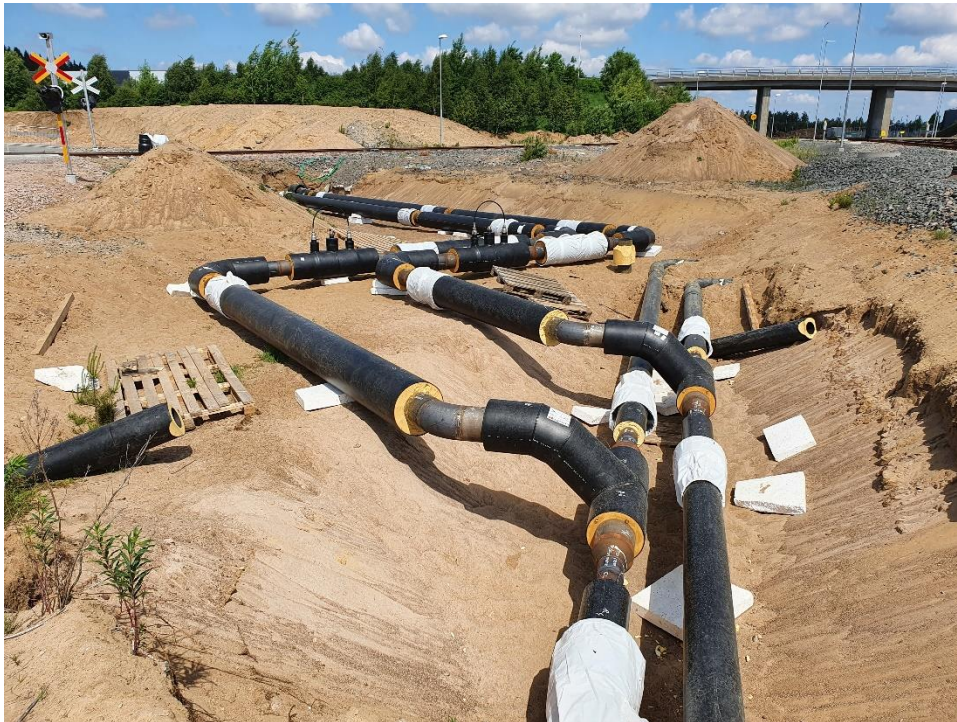
Fjärrvärmeledning till nya kunder

2021 var ett år med relativt lång och kall vinterperiod. Detta i kombination med stor ökning nya kunder gjorde att maxkapacitet uppnåddes i biobränsleproduktionen vilket medfört ökad fossil användning.