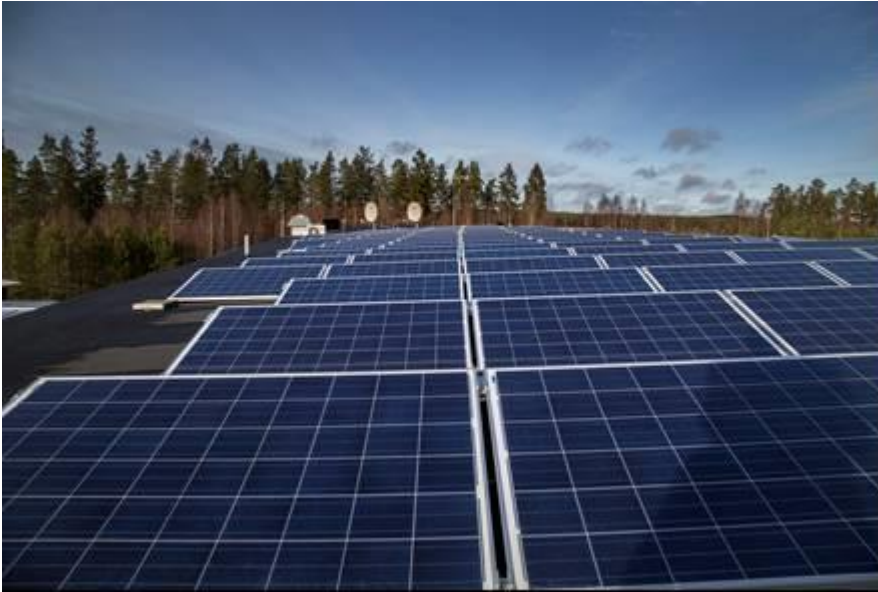
Företagets solceller står för cirka 35 % av byggnadens behov.