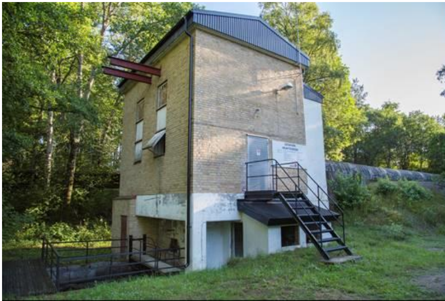
Götafors kraftstation vid Lagan

Dammanläggningen har anor sedan 1600-talet och elproduktion har bedrivits på plats sedan 1903.