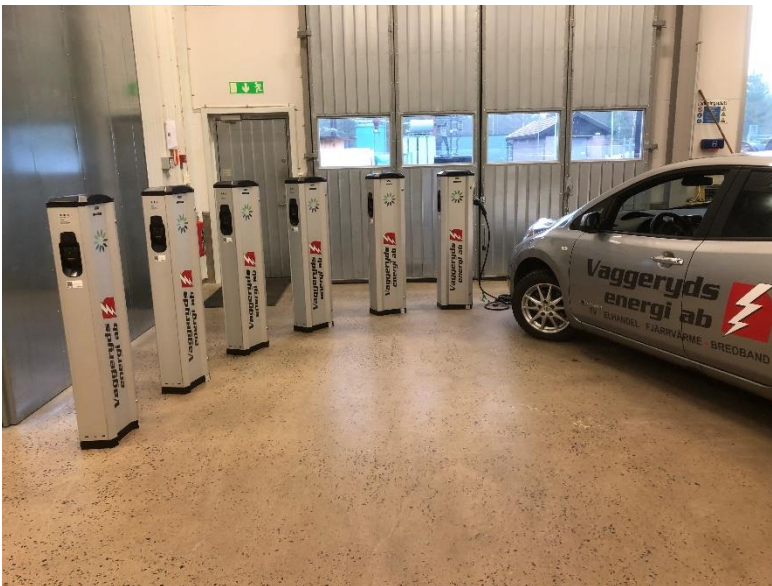
6 st nya laddstolpar på väg ut i laddinfrastrukturen.

Vaggeryds energi levererade ca 90 000 kWh fordonsladdning under året. Ytterligare några laddstolpar har uppförts för hemtjänsten vid Furugården och vid Fenix. Vaggeryds energi sköter även tillsyn och underhåll för 4st laddplatser åt Tallnässtiftelsen.