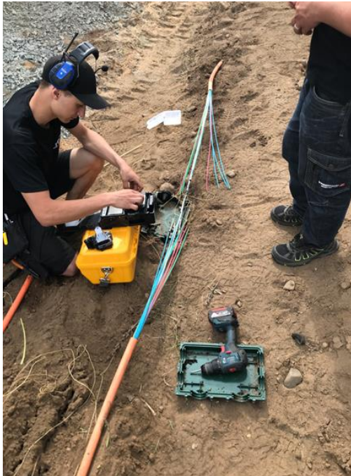
Kabelfel på Lyckorna (Avgrävning)

Investeringarna i bolagets fibernät uppgick till ca 9,8 Mkr.