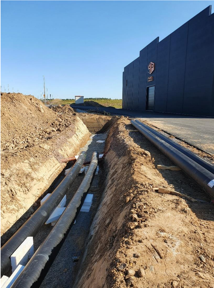
Etablering nytt fjärrvärmenät Södra Stigamo

Lång driftperiod med mycket hög belastning i produktionen har medfört flera stora driftstörningar och utmaningar av underhållet. Engagerad driftpersonal har hanterat detta föredömligt och leveransstörningar till kunder har varit marginella. Distributionsnätet har fungerat tillfredsställande helt utan läckage eller driftstörningar.