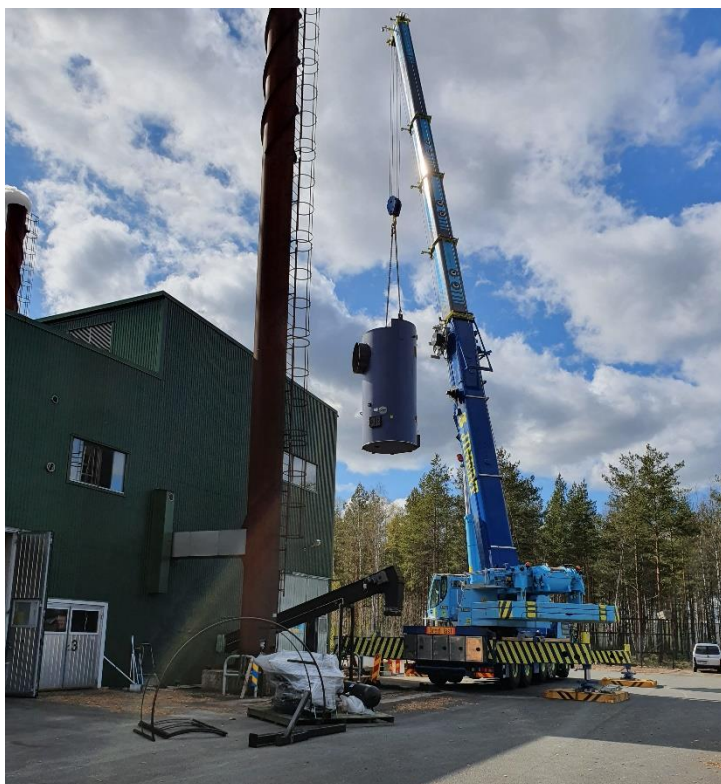
Byte av tryckkärl Vaggeryd

Under året har distributionsnätet fungerat tillfredsställande. Inga läckage eller driftstörningar har skett. På Värmeverket i Vaggeryd har byte av tryckkärl genomförts på en av biobränslepannorna.