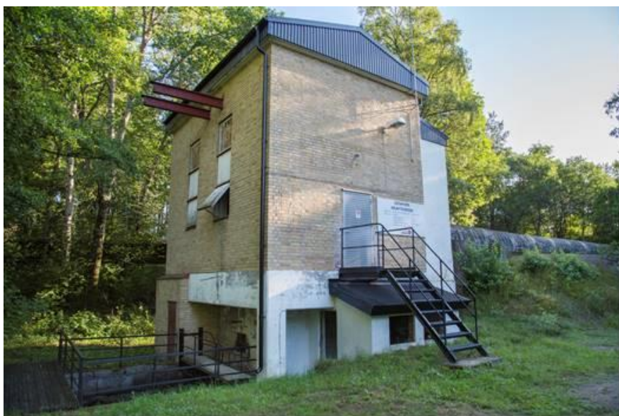
Götafors kraftstation vid Lagan

Dammanläggningen har anor sedan 1600-talet och elproduktion har bedrivits på plats sedan 1903.