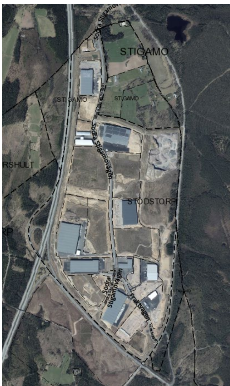
Ortofoto över planområdet