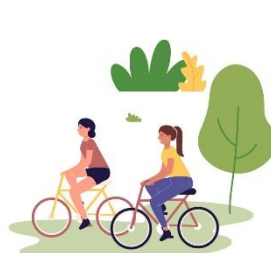
Kultur, fritid och friluftsutbud