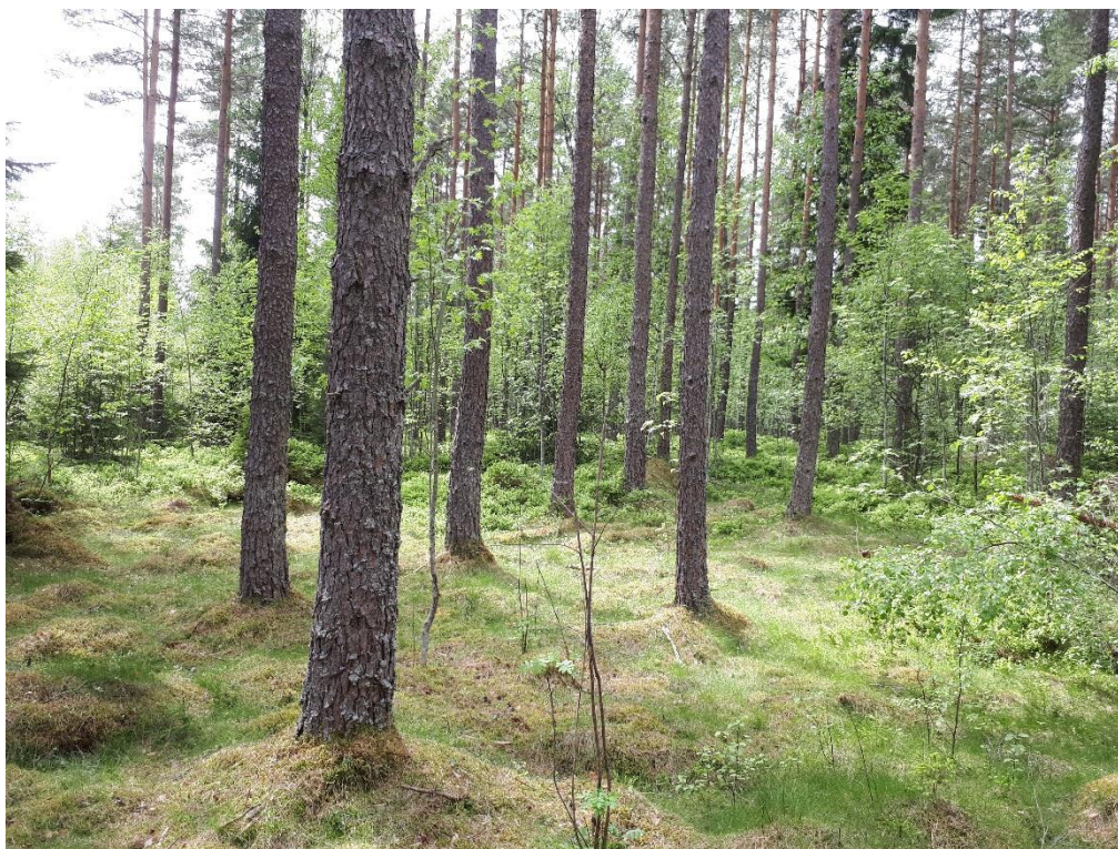
Figur 3. Bilden visar delar av delområde B.