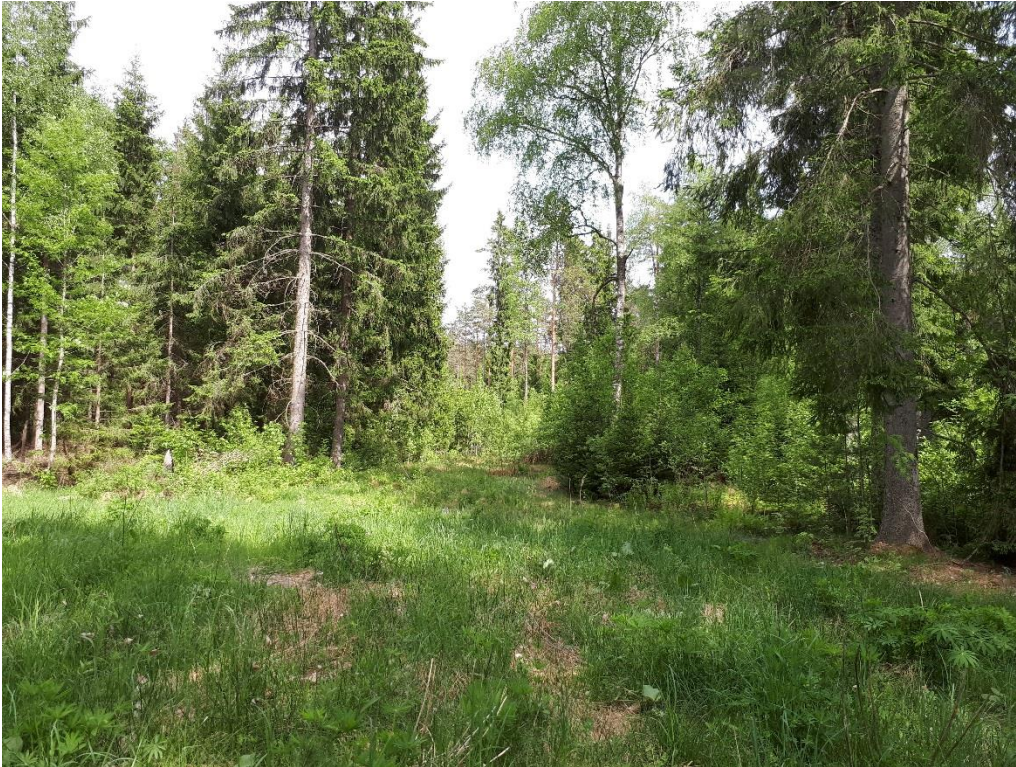
Figur 4. Figuren visar delar av delområde C.