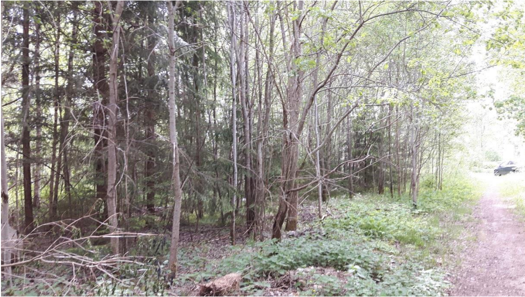
Figur 2. Bilden visar delar av delområde A.