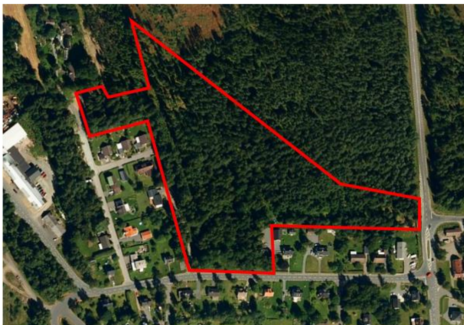
Figur 1. Figuren visar det inventerade området.

Naturvärdesinventeringen omfattar ett ca 5,4 ha stort område norr om Hok, Vaggeryds kommun. Inventeringsområdet framgår av figur 1 nedan.