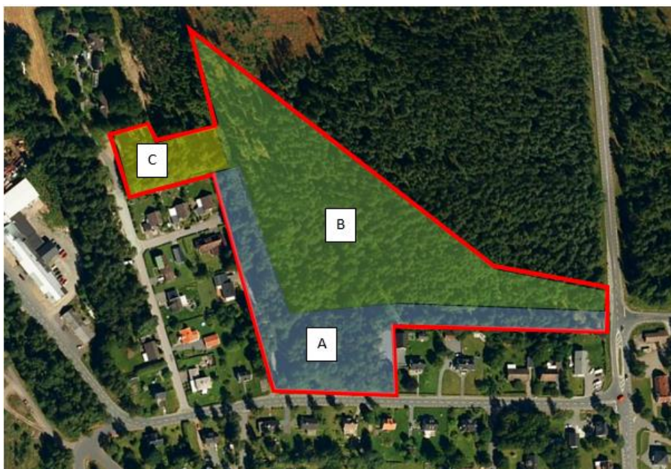
Figur 2. Det inventerade området delas in i tre olika delområden.